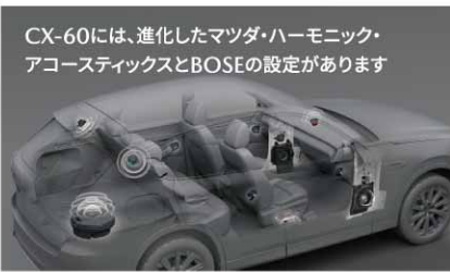
CX-60には、進化したマツダ・ハーモニック・アコースティクスとBOSEの設定があります

こうした新しいライフスタイルが広がっていくためには、インフラを作ったあともビジネスとして成り立つよう国や自治体のサポートが必要ではないかと感じています。