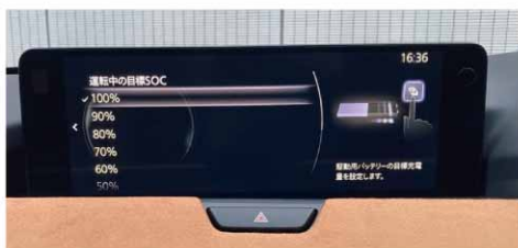
チャージモードは、設定された目標SOC%を維持して走行。100%で設定しておく。EVモードに切り替えられた際、満充電の状態から走り出すことができます。