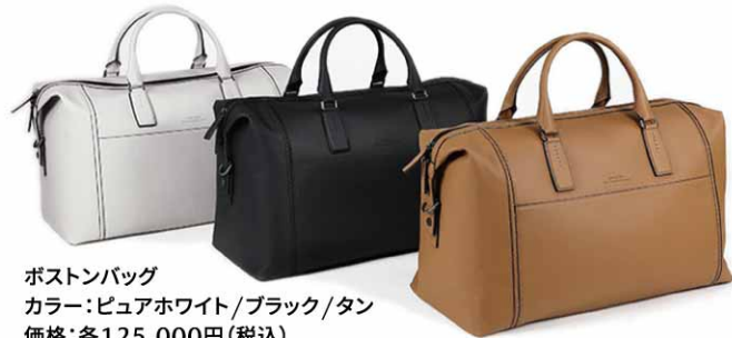
ポストンバッグ カラー:ピュアホワイト/ブラック/タン 価格:各125,000円(税込)

また、スマホサイズにぴったりな外ポケットやシューズも楽々収納できる大容量コンパートメント、そして付属のショルダーストラップなど、機能性も充実した仕上がりとなっています。 CX-60のTVCMにも登場した今回のポストンバッグは、大阪にある老舗鞆ブランド「FUJI-TAKA」とのコラボ商品です。伝統を継承してきた一流の職人が心を込めて、一つひとつのバッグを丁寧に制作しています。