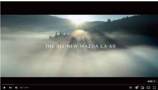
「CX-60の動画も魅力的で、ナレーションにも共感しました」

高速ではガソリン走行でスポーティーな運転をして、自然あふれる場所に着いたらEVモードに切り替えて優しく走る...そんな自由気ままな旅をどこも楽しみたいです。マツダの本社のある広島にもぜひ一度行ってみたいです。まだ納車から1カ月も経っていませんが、もっと運転したい、出かけたという気持ちが高まっています。毎日です。