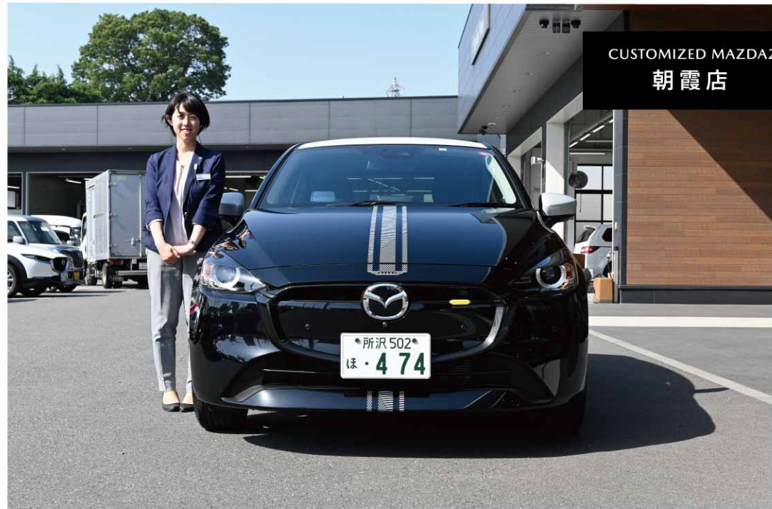
CUSTOMIZED MAZDA2 朝霞店