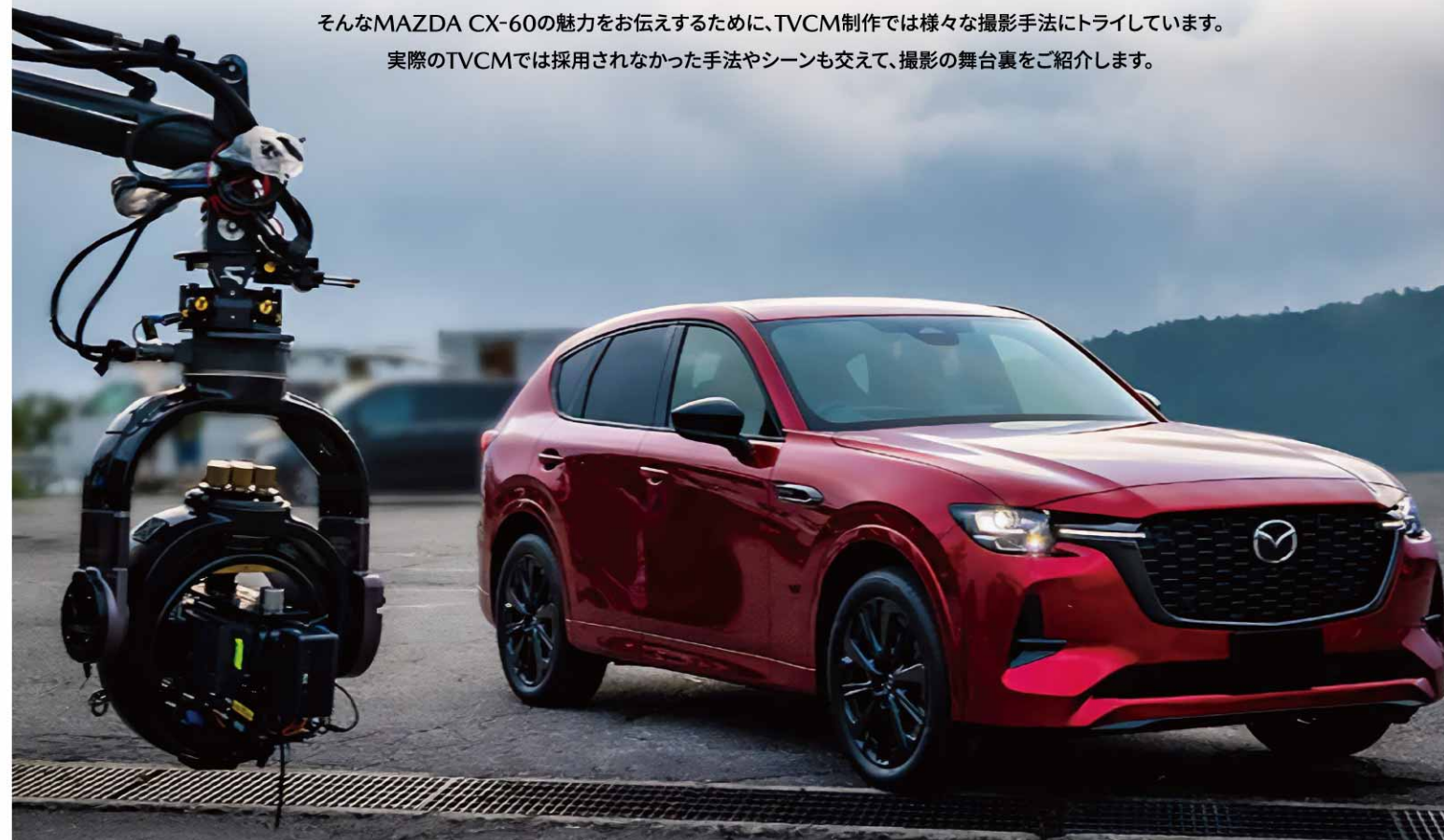
*この記事は2022年8月時点のものとなります。*TVCM撮影、及び本記事に掲載している写真、動画は許可を受け安全に配慮して撮影しています。*撮影車両は開発試作車です。実際の商品とは一部仕様が異なります。

実際のTVCMでは採用されなかった手法やシーンも交えて、撮影の舞台裏をご紹介します。