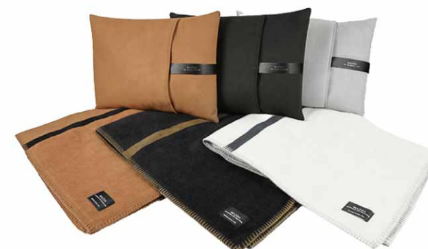
クッションブランケット カラー:タン/ブラック/ピュアホワイト 価格:各18,000円(税込)

CUSHION BLANKET ドライプシーンに寄り添う 柔らかな温もり 人と地球にやさしいオーガニックコットンを使用し、時間をかけて丁寧に織りあげられたブランケット。保温性・保湿度の高さから乾燥しやすい寒い季節に最適なのもちろんのこと、通気性の高さから、暑い時期でも快適にお使いいただけます。またカバーに収納することで、クッションとしてもお使いいただけます。クッションカバーはマツダ車のインテリアに採用された素材を使用し、クルマとのコーディネートも楽しんでいただけるよう、デザインしました。 ブランケットは、日本の一大毛布産地「大阪・泉大津」にある、オーガニックコットンブランケットを日本で初めて生産した「日の出毛織」とのコラボ商品です。一日に十数枚しか造れない、柔らかな風合いをもつ商品を、創業当時からある昔ながらの織機を使い、丁寧に造り続けられています。