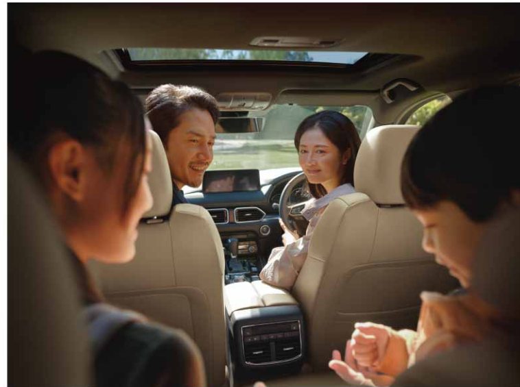
*1 ナッパレザーおよびスムースレザーシートのみ。*2 Sports Appearance, Exclusive Modeのみ対象。

活動的で頼もしい印象のエクステリア、明るく上品な質感で仕立てたインテリア。 Mi-Driveのオフロードモードにより、都市部だけではなくアウトドアでも安心して走りを楽しめます。 家族で自然の中へ出かけたい。行き帰りのドライブもみんなで快適に過ごしたい。 そんな想いに応える特別仕様車です。