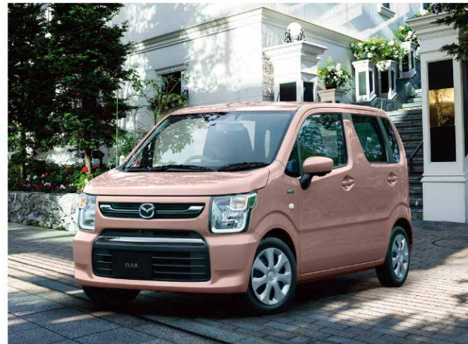
MAZDA FLAIR HYBRID XG