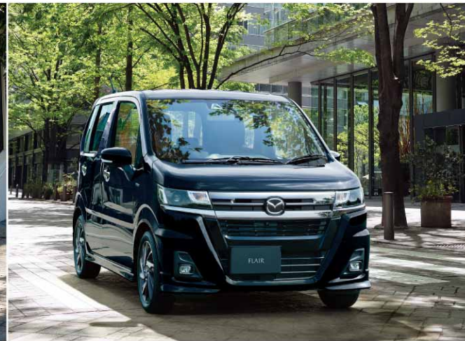
MAZDA FLAIR HYBRID XT