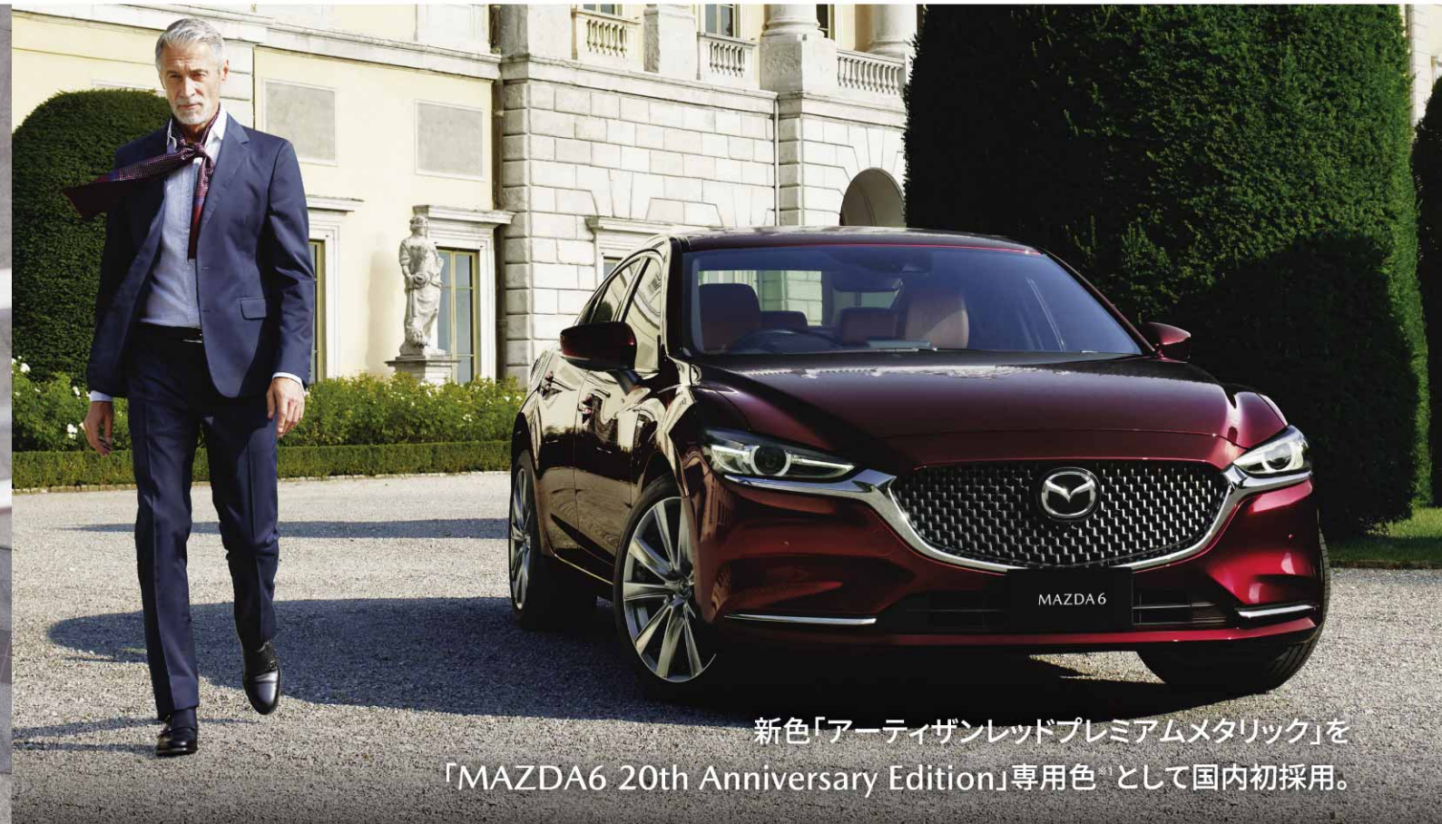
新色「アーティザンレッドプレミアムメタリック」を 「MAZDA6 20th Anniversary Edition」専用色 ※ として国内初採用。